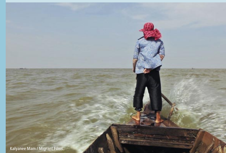
Kalyanee Mam / Migrant Films

19:00 – 20:30 THE WRONG CLIMATE FOR DAMMING RIVERS und weitere Kurzfilme WATER TO DUST (23 Min.) – Dokumentation von Narissa Allibhai über die dramatischen Auswirkungen der Gilgel-Gibe-Staudämme in Äthiopien auf den Lake Turkana in Kenia. Kenia 2016, englische OF Diskussion: Die Verantwortung deutscher Unternehmen in Staudammkonflikten mit Christian Russau und Thilo Papacek (GegenStrömung) 20:30 – 22:00 A RIVER CHANGES COURSE (90 Min.) von Kalyanee Mam, USA 2013, OmengLU