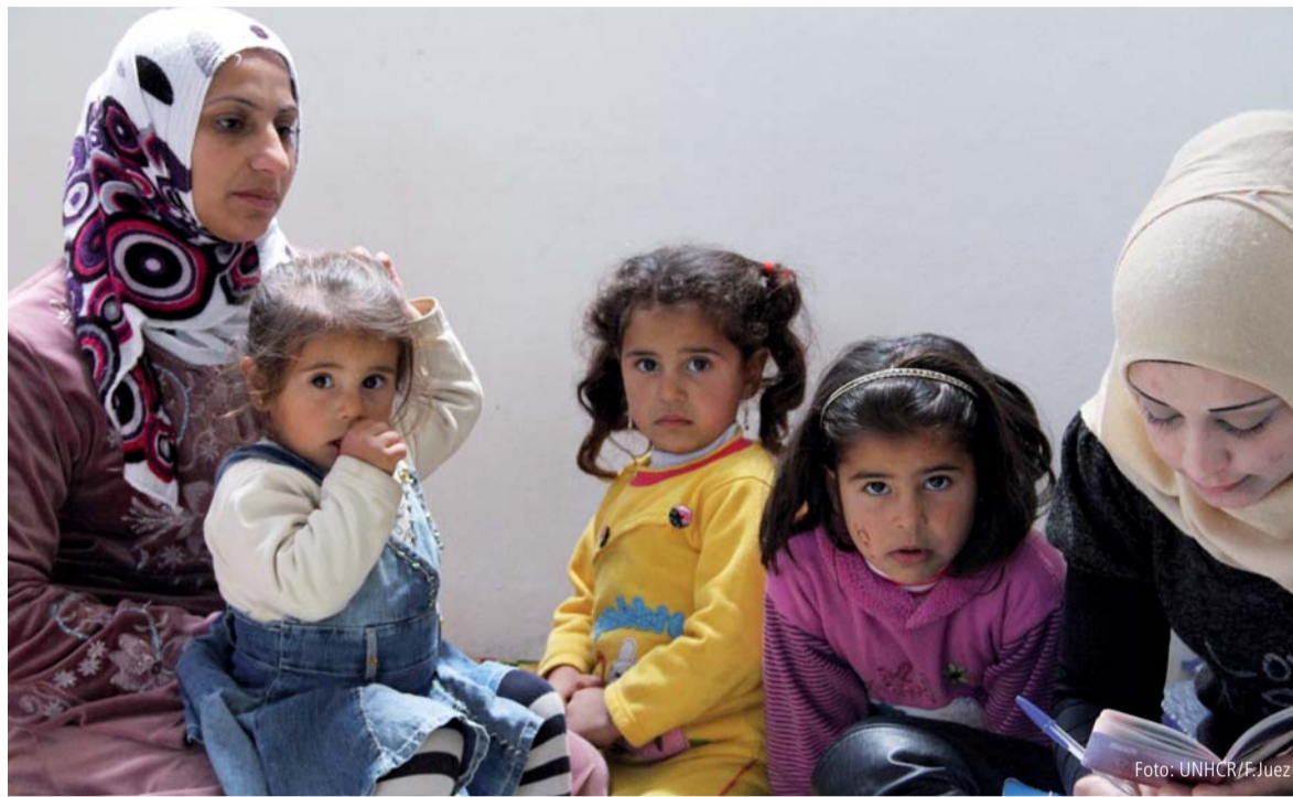
Syrische Flüchtlingsfamilie bei der Registrierung in Wadi Khaled, Libanon.

Gewerkschaften stehen für die Humanisierung der Arbeitswelt, die sich rasant verändert. Menschenwürde, Empathie und Solidarität sind Werte, die unser Handeln prägen. Deshalb fordert die IG BCE auf, sich nicht den Herausforderungen der Flüchtlingsbewegung zu entziehen, sondern zu handeln. Da, wo immer Gewerkschafterinnen und Gewerkschafter agieren, müssen unsere Vorstellungen eines menschenwürdigen Lebens adressiert werden an die Politik, an die Wirtschaft, an unsere Kolleginnen und Kollegen und auch an unsere Nachbarinnen und Nachbarn. Menschen verlassen ihr Land, weil sie Angst vor Zerstörung ihrer Existenz haben. Die Angst um ihr Leben und das ihrer Kinder ist so groß, dass sie vor dieser Gewalt fliehen. Oftmals traumatisiert, in hohem Maße verunsichert und ja, auch Sehnsucht nach ihrer