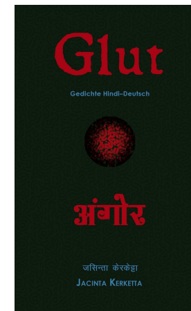
Draupadi Verlag, Heidelberg 2016, € 12,-