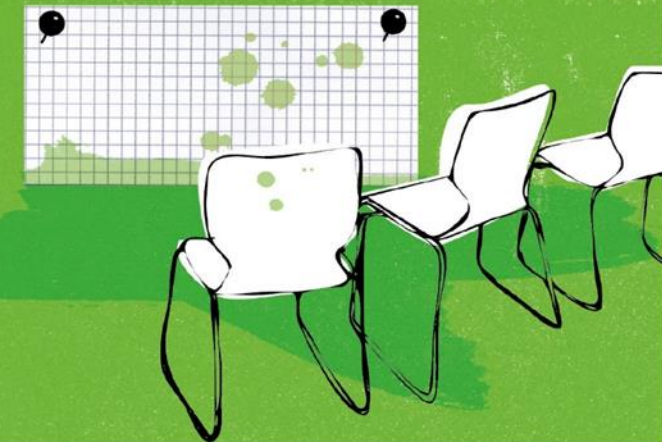
Illustration: © Bente Schipp