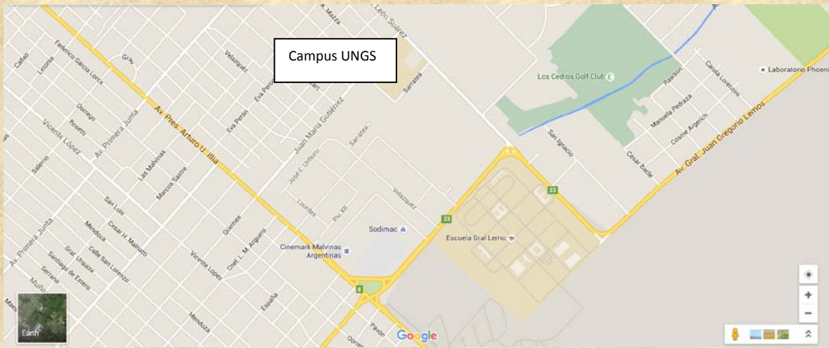
Campus UNGS: Juan María Gutiérrez 1150, Los Polvorines, Partido de Malvinas Argentinas, Buenos Aires